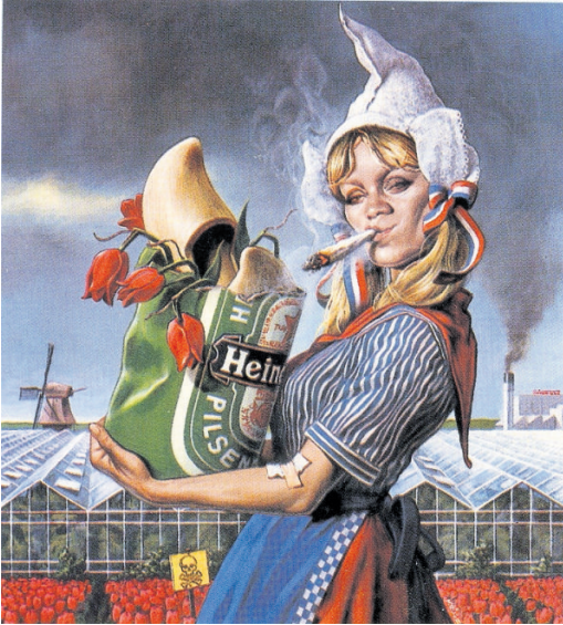
Het weekblad Der Spiegel kwam in 1994 met een negatief artikel over de westerburen onder de veelzeggende kop 'Frau Antje in de overgang'.

voorbeelden en anekdotes. Zijn boek gaat niet alleen over de relatie tussen de twee landen, maar ook heel nadrukkelijk over de veranderingen – om niet te zeggen schokgolven – in de Nederlandse maatschappij sinds eind 1989, met twee politieke moorden als dieptepunt.