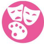
Kunst & Cultuur