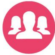
Mens & Maatschappij