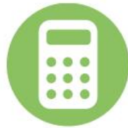
Rekenen & Wiskunde