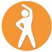
Bewegen & Sport