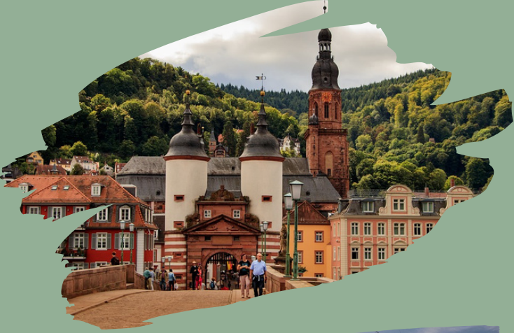
Frédérique vor dem Heidelberger Schloss