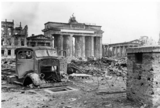
Pariser Platz in Berlijn, juni 1945

Klik op de afbeelding om de interactieve tijdlijn te openen.